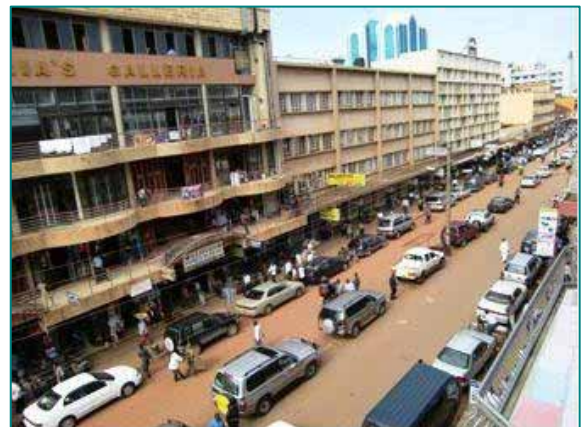
首都カンパラ。 (中心部は整然とした街並みです。)

宗教は早くからヨーロッパの宣教師がやってきて布教活動を行ったことや、第二次世界大戦後はイギリス連邦に属していたこともあり、