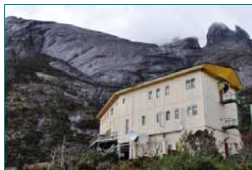
ラバンラタ・レストハウス

http://www.vec.gr.jp/mag/258/mag_258.pdf