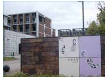
京都大学 (右手奥がC2クラスター棟)

検証概要は、京都大学桂キャンパスのC2クラスター棟の2室において、夏期および冬期の内窓取付け前後の窓面温度および室内空気温度・壁面表面温度の計測、工