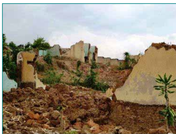
大虐殺により破壊、放棄された村。 (このような村が各地にあり、今でも被害者の遺体が発見されています。)