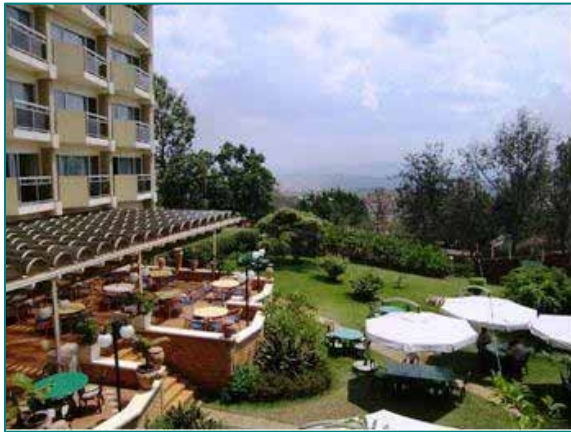
現在の Hotel des Mille Collines

この大虐殺については、テレビのドキュメンタリーなどでも数多く取り上げられるとともに、ホテルの支配人が 1200 人以上の人たちをホテルに匿った実話をもとにした「ホテル・ルワンダ」という映画も作成されています。