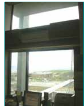
検証対象窓のひとつ 上下の窓(ペアガラス)共に内窓を設置