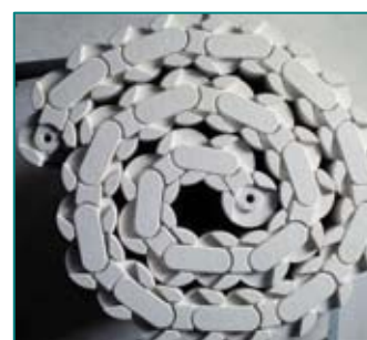
“Snake”を収納した際の 上から見た状態