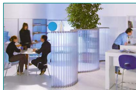
“Snake”の設置の様子 (PVC Today Magazine より)

パーティション“スネーク”は、1987年、イタリアのコンパッソ・ドーロ賞（工業デザイン賞）選抜作品、1988年にはドイツのオルガテック・オフィスデザイン賞を受賞しています。材料は塩ビパイプですが、通常使われるパイプではなく、特殊仕様で押出し成形されたパイプだそうです。色は、白、グレー、透明、スリガラス調とあり、欠けた月のような形を