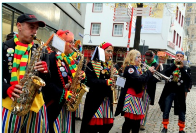
ケルンのカーニバル

欧州のカーニバルは、その地域ごとに何をテーマにするのか特色があるのですが（たとえば、フィレンツェのカーニバルはやはり！といった感じの中世の仮装、ヴェネツィアも中世風の仮装ですが仮面で顔を隠しているのが特徴、そしてカーニバルが賑やかなことで有名なドイツのケルンのカーニバルは現代のアニメのコスチューム等グループで同じコ