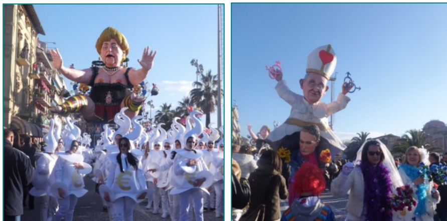
「ここまでやるの？」世相風刺満載のヴィアレージョの山車

バルでもあり、日本と比較すると欧州は若者も含めて本当に政治に関心をもっているのだな、と感心します（普通の主婦とお茶のみ話でも、政権の話がでてきますから、やはり日本人とは意識が違ふと思います）。もちろん、風刺ものだけでなく、子供たちが喜びそうな巨大恐竜やロボットもあり、華やかな行列もあり、春に向けての楽しい気分を盛り上げてくれます。この山車、紙の張子（ねぶたみみたいな感じですね）、工房で作成されているそうです。