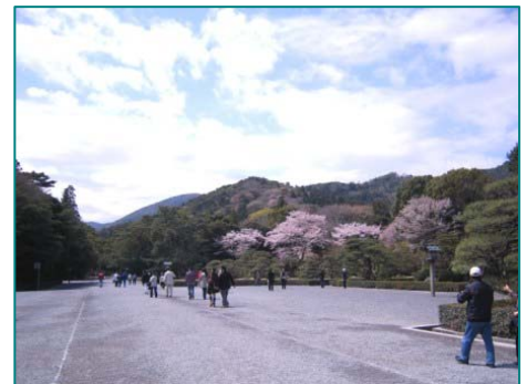
伊勢神宮 内宮 参道

次に、直木孝次郎氏の場合を見てみよう。氏は戦後間もない昭和二十六年に「天照大神と伊勢神宮の起源」(『日本古代の氏族と天皇』塙書房、一九六四、所収)を世に問い、新しい時代における天照大神・伊勢神宮問題の一つの考え方を提示した。氏の所説の要点をまとめると次のようになる。( )内、筆者注