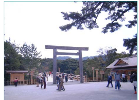
伊勢神宮 内宮 宇治橋

先ず、津田左右吉についてみて見よう。氏は、『日本古典の研究上』(岩波書店、一九四八)の中で天照大神 おほひるめむち と大日靈貴 おおひるめむち に関し、次のように述べている。