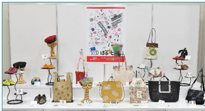
ファッション雑貨展示の様子

上田安子服飾専門学校ファッション工芸デザイン学科では、消しゴムメーカー (株)シード の協力(『 ほるナビ 』の提供・彫り方の指導)を得て、学生が各自で考案した図案でけしごむスタンプを作成し、革などの生地に押し、バッグ、帽子、シューズなどのファッション雑貨を製作する授業を3年前から行っています。