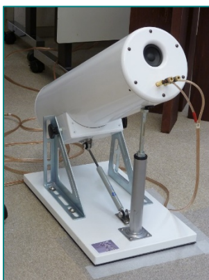
MS-06J ホワイトオーガー

今後もオフ会は毎年開催されていくとの事で、楽器作りと音へのこだわりはさらに広がっていくことが期待されます。