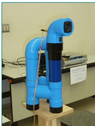
グフ風塩ビ管スピーカー

このオフ会は普段はインターネット上で意見交換をしている面々が、自作の塩ビ管スピーカーを持ち寄り、自慢の音を鳴らし音自慢し意見交換するのが目的です。様々な素材のスピーカーがある中で、塩ビ管を使うことによって、豊かな重低音とクリアな音質が出せるのが特徴で、DIYショップでいろいろな厚さ、径の違う管が比較的安価に入手でき、切ったりつないだりの工作が簡単で手軽に音作りができることから始まったとのこと。年に一度、この時期に集まることが恒例となったとはいえ、開催の都度新しい展開があることも、これまで長く続いている理由の一つでもあるようです。