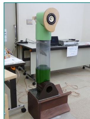
トルネードフライ + 88-Sol