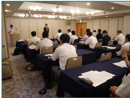
開会式での主査挨拶の様子

最後には、参加者全員で、無事故・無災害操業の継続、安全レベル・現場力の向上に努めることを確認し閉会となりました。「ご安全に！」