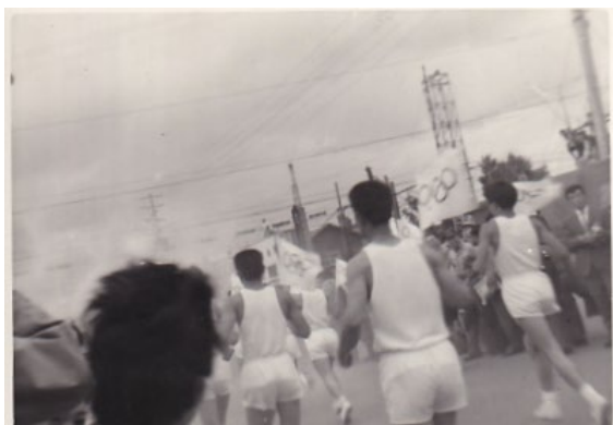
写真1, 2. 札幌の街を走る聖火ランナー (1964年9月頃、豊平橋付近にて)