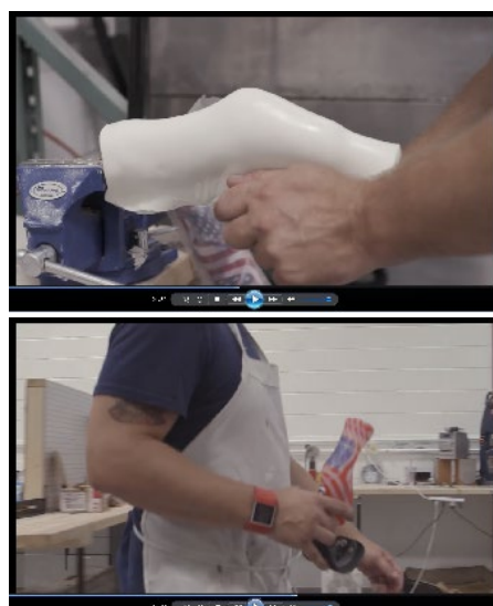
図 2. 犬用義足の作製シーン

さて、64 年の東京オリンピックの時は、三波春夫が歌った「東京五輪音頭」が大ヒットしたが、これとは別に「東京オリンピックの歌」という曲があったことをご存じだろうか。潑刺として好きな歌だったが、あまり歌われることなく消えていった。前者が当時はまだ珍しい海外からの人々を迎える国民の視点で書かれているのに対し、後者は選手の視点で書かれているため、大衆の共感を得られなかったのかも知れない。