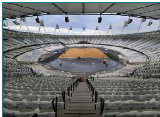
ECVM ホームページより

以前にも メルマガ で、オリンピック競技場の屋根材として142,000 m 2 もの塩ビターポリンが使われていることを紹介しました。その広さは、月並みの比較をすると東京ドーム3個分の屋根の広さに相当します。オリンピックとパラリンピックが終わった後には、一時的な使用を目的として建設された建物の屋根材は、回収され、リサイクルされることになっています。その方法は、欧州で開発された一種の溶媒抽出技術によるもので、昨年は、7,500トンの廃棄物を処理した実績を有しています。そして、回収された再生塩ビは、2014年ブラジルで開催されるサッカーワールドカップ会場の屋根材に使われたり、次のオリンピックで使われる計画になっているとのことで、ワールドワイドなスポーツイベントに使われていく塩ビは、まさに持続可能な材料のシンボルのひとつではないでしょうか!?