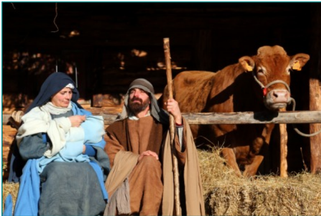
人間プレセーピオ

そんな感じで、大騒ぎして新年を迎えますが、イタリアでは、クリスマスの飾りは1月6日のエピファニアのお祭りまで片づけられません。なので、クリスマスが終わっても、街の中はキラキラしています。そして、1月6日、この日魔女が子供たちにお菓子を配り、クリスマスのお祭りも終わり、ツリーが片づけられ、イルミネーションもおしまいです。