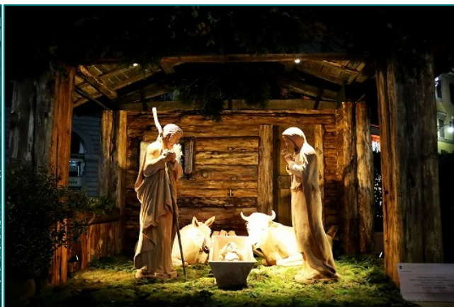
ドゥーモの前のツリーとプレセーピオ