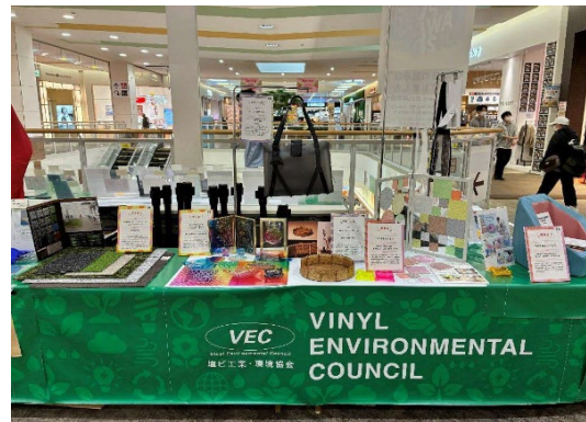
(名古屋、イオンタウン千種、3/19~21)